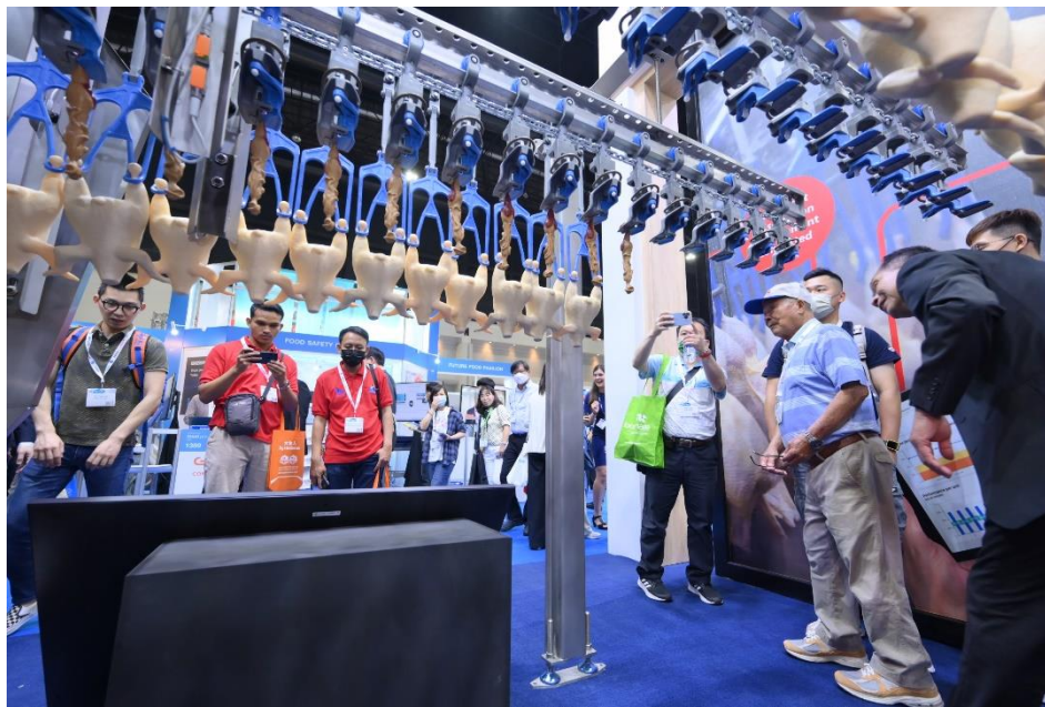
参与者在 Meat Pro Asia 现场交谈

作为肉类及食品加工、包装行业的新秀，首届亚洲国际肉类加工设备与技术展览会（以下简称： Meat Pro Asia ）喜迎大批来自东盟地区的专业观众。首次举办的 Meat Pro Asia 汇聚了众多高质量的参与者，展会已于 3 月 10 日圆满落幕。在为期三天的展览期间，共吸引了来自全球 89 个国家的 8,894 名观众莅临现场，超 100 家参展企业参与其中。对于本届展会的整体效果，与会各方纷纷赞赏有加，主办方更是收获无数好评，这也为 Meat Pro Asia 的未来发展注入了无限潜力。 Meat Pro Asia 与 VIV Asia （亚洲最大的牲畜生产和畜牧业领域专业展览会）同期举办，两展共迎来 47,527 名专业观众亲临现场。